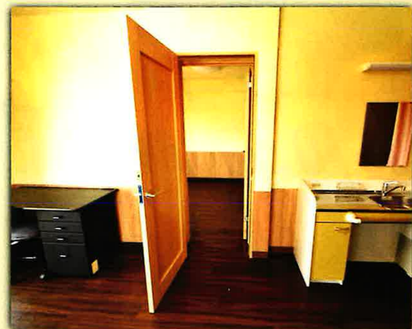
自由にお部屋を行き来できるコネクティングルーム